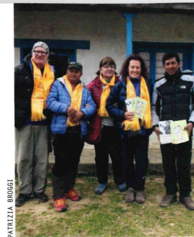
Fra le attività di Eco Himal ci sono la consegna alle scuole rurali di libretti illustrati con le favole himalayane (sopra) e i corsi di informatica per non vedenti a Pokhara (sotto).