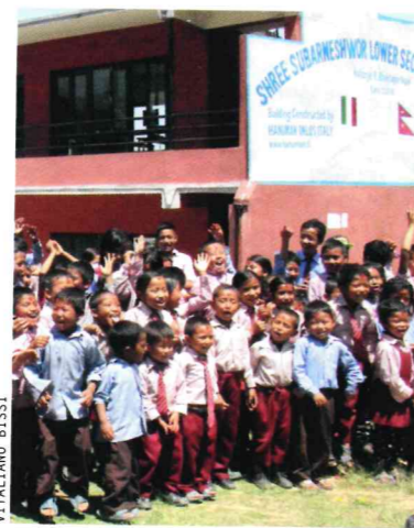
Inaugurata nel 2018 a Katunje, la Shree Subameshwor Primary School (nelle foto qui sopra) è stata costruita grazie alla onlus Hanuman. Ha 182 studenti da 5 a 13 anni.

Ricevere e donare. Questo è il mantra dei viaggiatori