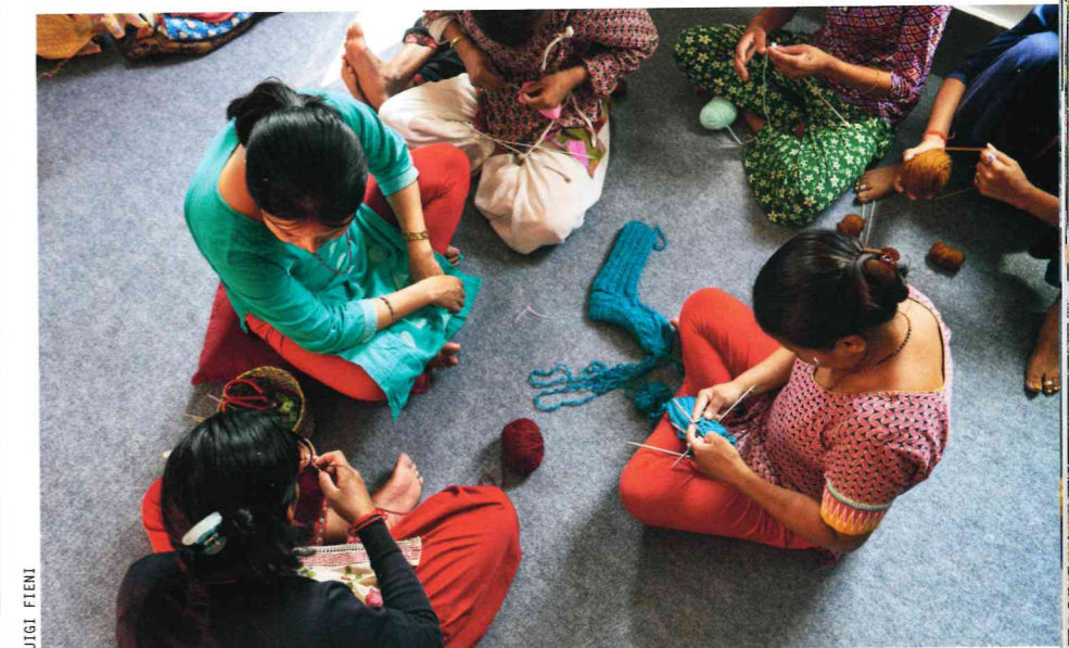
Qui sopra e a sinistra, corsi di formazione professionale per le ospiti di CasaNepal, affinché acquisiscano abilità e competenze indispensabili per raggiungere l'indipendenza economica. Ogni anno almeno 60 donne e 20 bambini beneficiano di questo progetto della Apeiron.